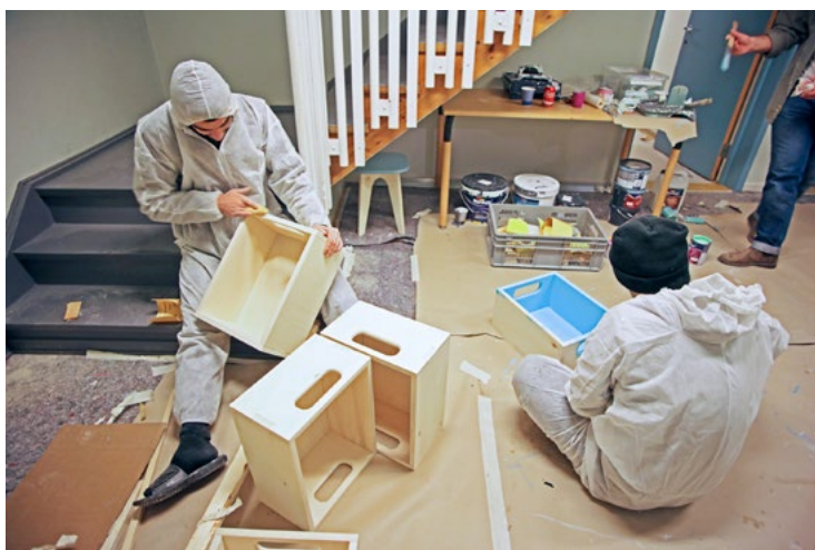
To beboere som monterer, pusser og maler lekekasser.