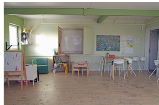
Slik det fremsto tidligere.