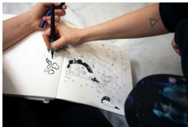
Idéworkshop med beboere og ansatte.

→ Beboere, frivillige, ansatte og Makers'Hub i full sving med montering av møbler.