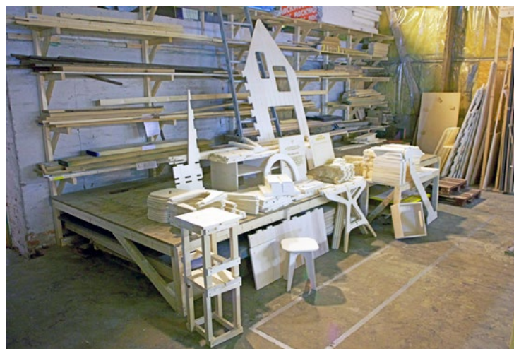
Fellesverkstedet hvor poppelfinerplatene blir frest til byggesett.

Rommet som møtte interiørarkitektene første gang de så det, var et trist syn. I sin egenhet har rommet et godt utgangspunkt ettersom tilstrømming av dagslys er konstant gjennom mange vinduer. Rommet er relativt lite i størrelse og måler kun 6 x 6,5 meter og 2,4 meter i takhøyde, men føles romslig. Rommet ble oppfattet derimot som lite inviterende med sitt daværende innhold og dårlige stand. De ansatte beskriver det som et rom med mye leker, men lite struktur og tilfeldige møbler samlet over tid. Mangel på organisering fører til at rommet ikke kunne brukes av barn og familier uten oppsyn fra de ansatte eller frivillige. Resultatet blir en dør som sto låst mesteparten av tiden.