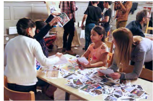
Idemylldring med barn og unge.