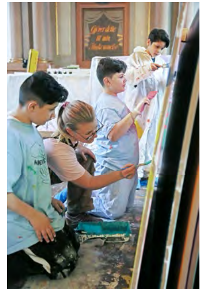
Det var et enormt arbeid å male alle platene, tre strok på hver side, samt logistikk ved tørking.