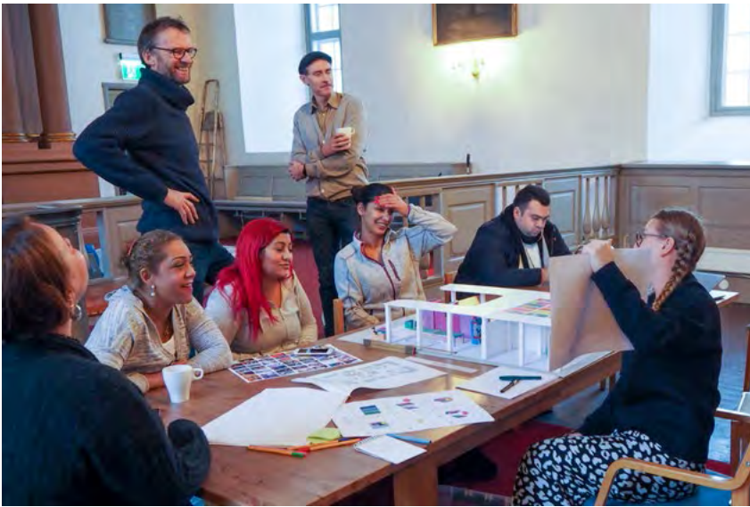
Designmøte med prosjektgruppen bestående av ansatte fra Kirkens Bymisjon og representanter fra det norske rom-miljøet.