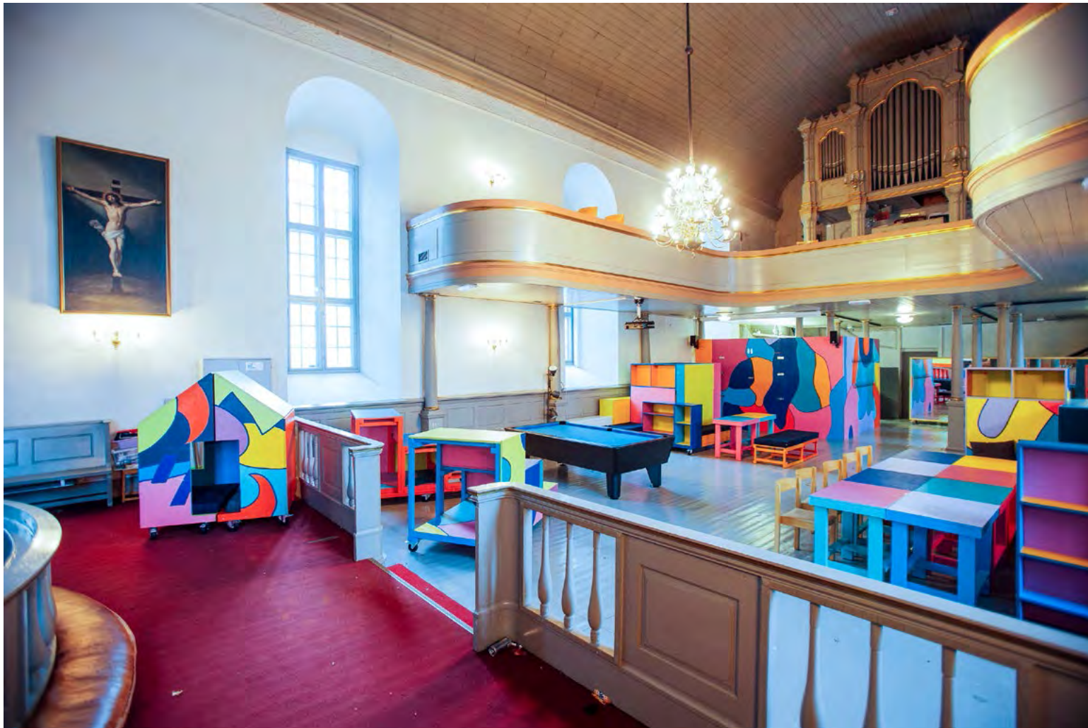
Det ble bygget 32 interiørelementer.

→ Totalkostnad for hele prosjektet var ca. 400 000. Det krever kreativitet i løsningene.