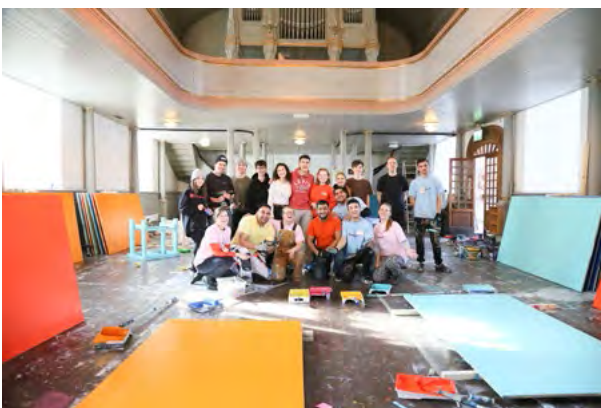
I løpet av 16 arbeidsdager var interiøret bygget klart med god hjelp fra mange frivillige fra rom-miljøet, og frivillige fra deres egen organisasjon. Byggedagene var lange og intense.