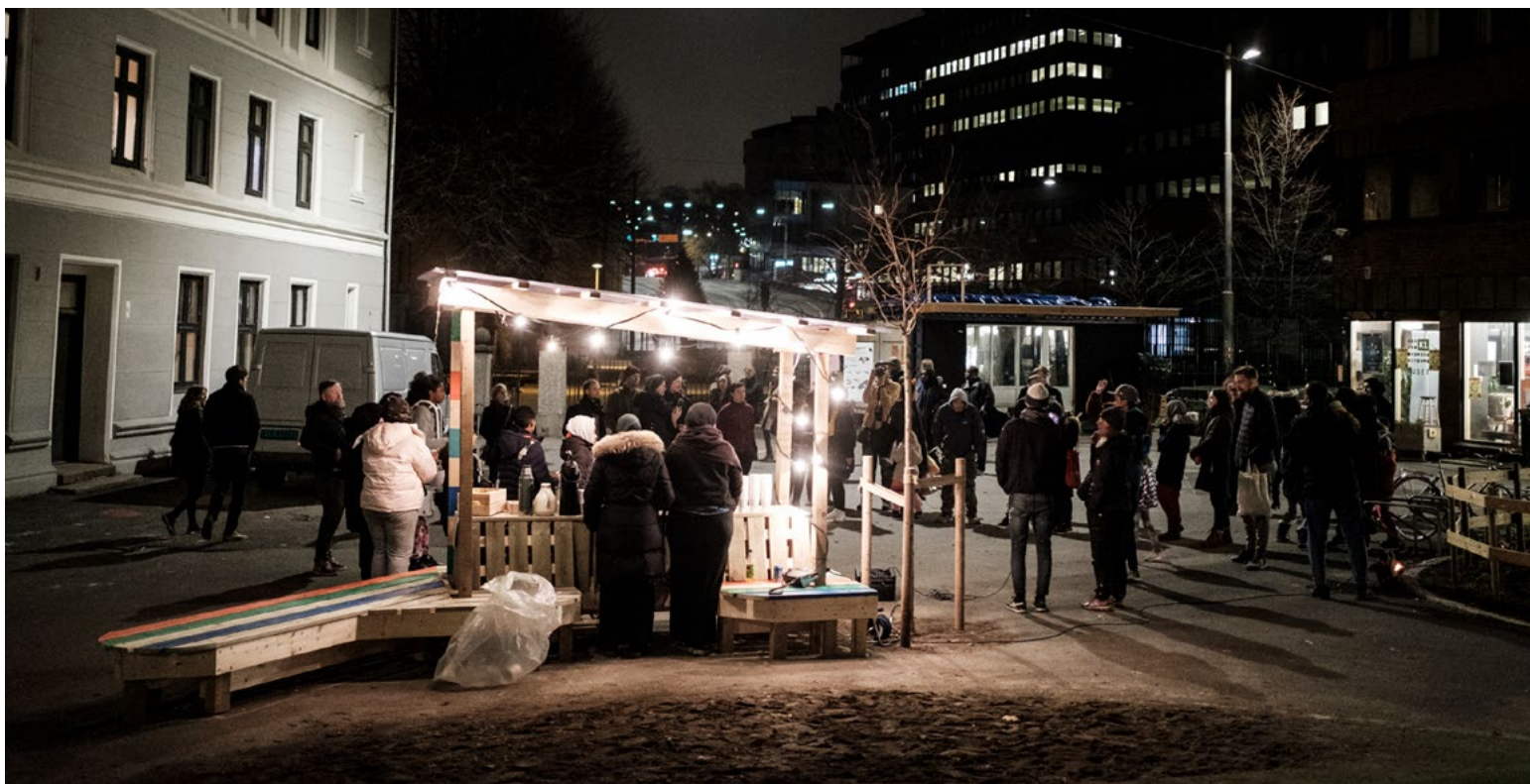
Et ønske om en permanent bod, med tak, der man enkelt kunne arrangere for eksempel servering eller salg av noe lokal tilvirkning.

transformerte MakersHub noen utvalgte innspill til midlertidige strukturer, som skulle bygges på fire dager av et team med ufaglærte medsekkere. I designprosessen valgte MakersHub å fokusere på tre behov som kom frem under innsiktfasen: