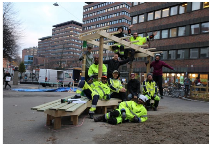
Til byggeprosessen, ansatte de et arbeidsteam på seks personer fra lokalmiljøet. Interiørarkitekten utlyste stillingene spesielt til ungdommer mellom 18–25 år, fordi målgruppen selv hadde etterspurt flere jobbmuligheter.