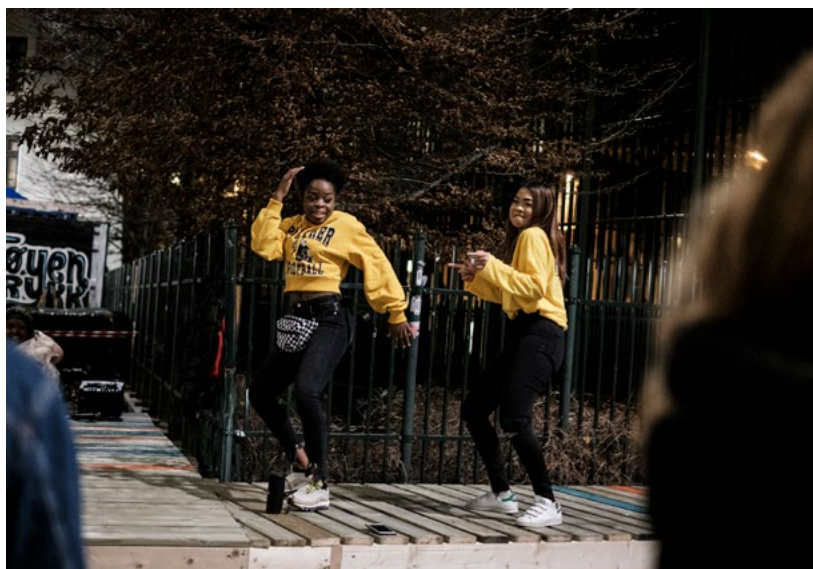
Ungdommer løftes også frem som en spesielt trendende gruppe av gode uterom på Tøyen. Ungdom ønsket seg en scene, der de kunne øve på dans og ha mindre konserter for hverandre.