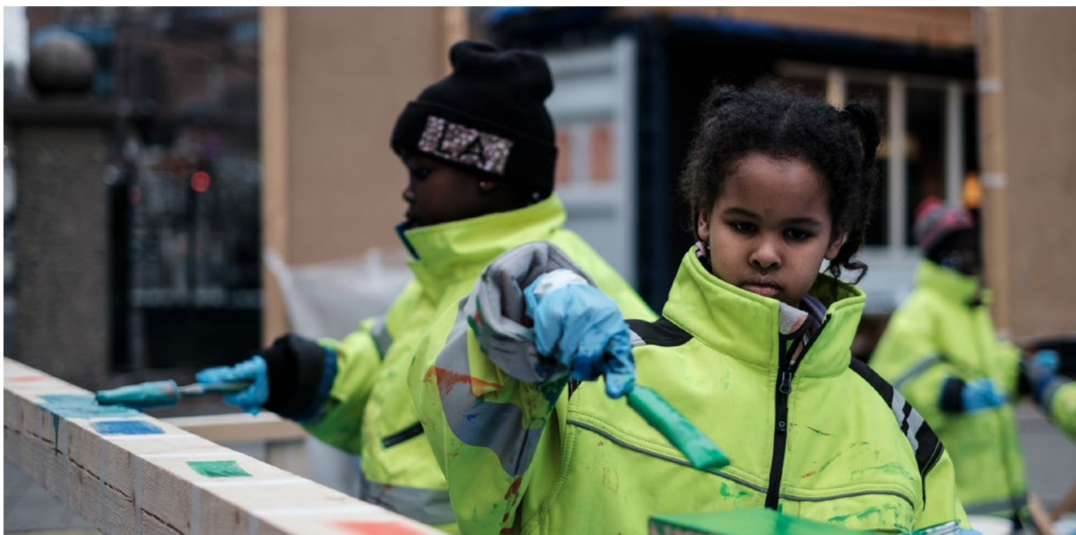
Målgruppen var unge og unge voksne.