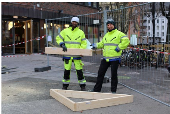
Prosjektet var delt opp i fem faser: innsikt, design, bygging, aktivisering og evaluering. MakersHub hadde primært ansvaret for selve byggingen av de midlertidige strukturene.