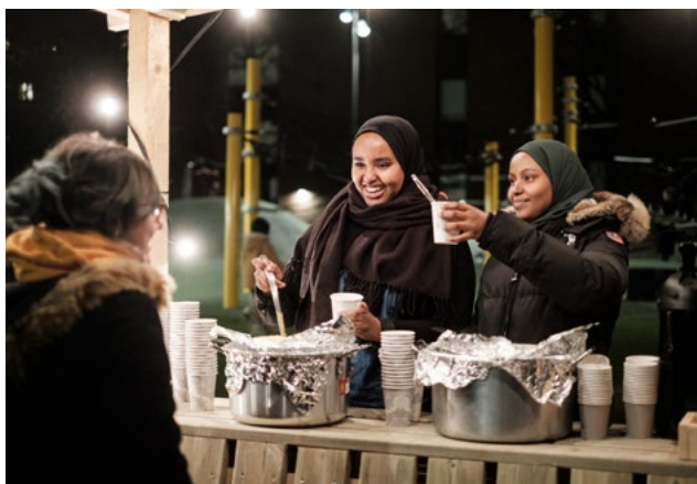
Det skal tilrettelegges for at det kan foregå ulike aktiviteter med og for folk på Tøyen.